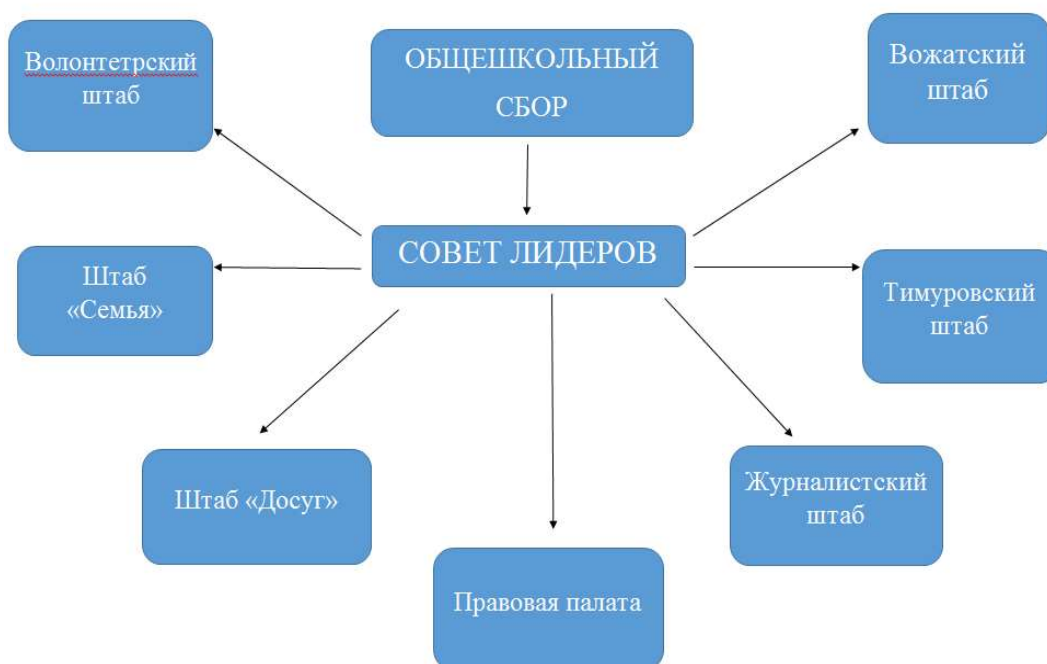
Структура ДОО «Новое поколение»

Высшим органом является Общий сбор, созываемый один раз в год по мере необходимости. В промежутках между собраниями их функции выполняет выборный орган - Совет Лидеров. Основные направления деятельности: